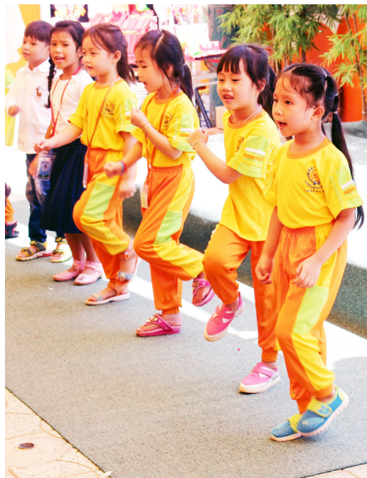
▲ 幼兒班小朋友生動活潑表演。