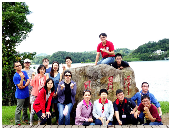
▲ 日月潭美景讓人流連。

中午時，因行程臨時改變，沒找到吃午餐的地方；後來上網找到一家餐廳，當天雖然沒有營業，但有別人已先預定了便當，所以餐廳也同意為我們一行人準備中餐，非常感謝老闆，也很感恩上天的慈悲，讓我們有美好的旅程。