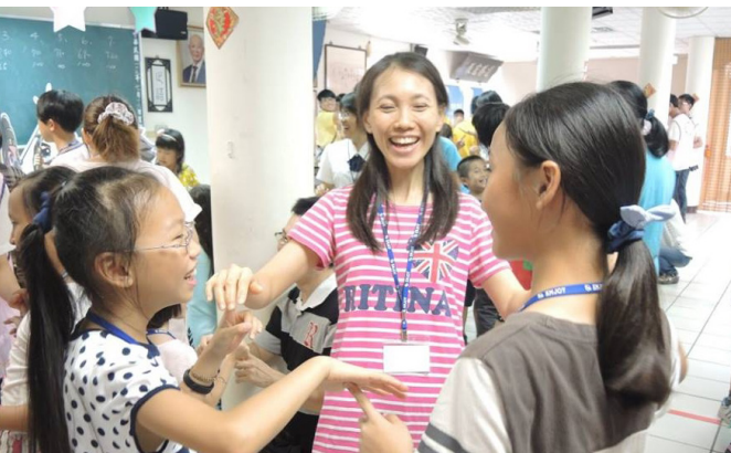
▲ 親子之間，快樂學習，一起成長。

最後的「智關」，則是透過詩句拼湊，與合力完成讓 A4 紙負重書本的遊戲，期許學員在未來面對人生困頓時，運用智慧解決難題。