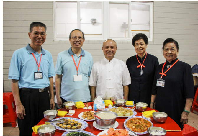
▲ 點傳師們熱情參與生服營。

來到生服營的第一天，就聽到這一首營歌，感覺這是一個非常大的挑戰。以前只有帶過國小道育營的經驗，覺得小朋友都很活潑；而這次要帶國高中生的學員們，年齡更大、自我意識更強，不知道會怎麼樣呢？但來了之後，發現其實大家都非常乖，高中生會幫忙照顧國中的同學，這是讓我感到驚訝的地方，或許是因為這些同學以前參加過，所以知道下一步要做什么，更會主動幫忙其他同組夥伴，讓我覺得這是營隊需要一直辦下去的理由。當然，爸媽常說：「多與仙佛接觸……」這也是理由之一。