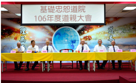
▲ 106 年度道親大會，各位委員列席。

基礎忠恕道院舉辦 106 年度道親大會，計有 136 位道親參加。 心靈成長班第一期講師二次驗收，共有 22 位講師參與驗收。