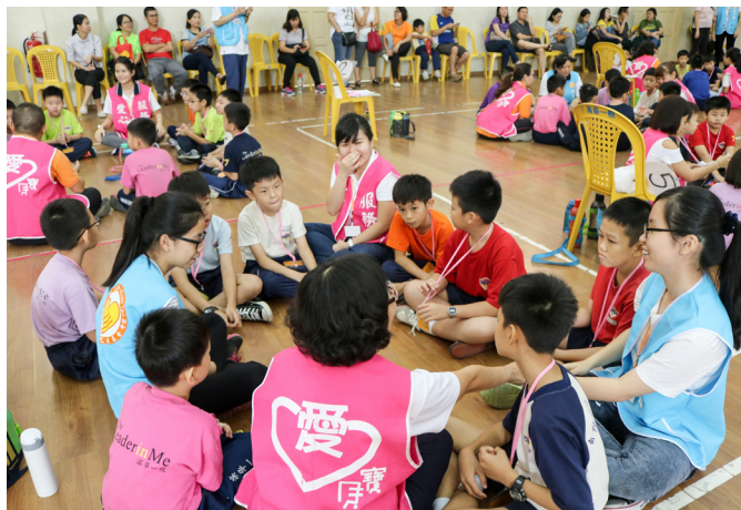
▲ 暖身活動，老師帶領孩子們互相認識。

出海關後，遠遠就看見點傳師站在出口處等我們，真是感恩。接下來兩天，一夥人分工合作，忙著場勘、製作名牌、採買、準備便當菜等相關工作。手裡做著、心裡想著，無非不是要如何將前置作業準備完美，讓當