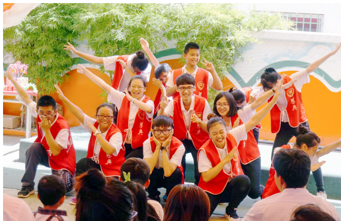
▲ 台灣青年學子來東服務並擔任主考官。

為了提倡中華文化，鼓勵學生學中文、學修道、讀經典法聖賢，蔡點傳師慈悲指示，只要能通過7個科目，即能得到銅典獎，珍貴的禮物是慈興「狀元筆」。當訊息佈達後，只要步入慈興國際學校，回首或轉身，即可看到學生們捧著經本、埋首於經書中，渾然忘我地投入聖人領域，似乎要以「吸取大法」把聖人的智慧語錄全部吸取予大腦。也許就是這一份的專注