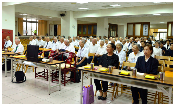
▲ 基礎忠恕道院 106 年度道親大會一景。