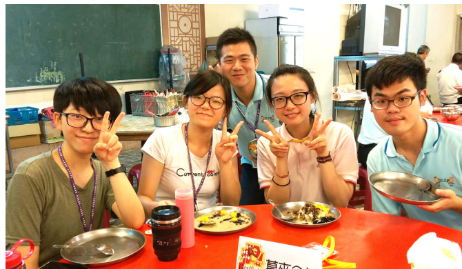
▲ 最開心的刨冰時間。

7月6日，是先行前往活動地點的日子。到達天德堂，休息一下，開始準備行政工作，那時候的人事學術組只有我一個人，慢慢想自己要做