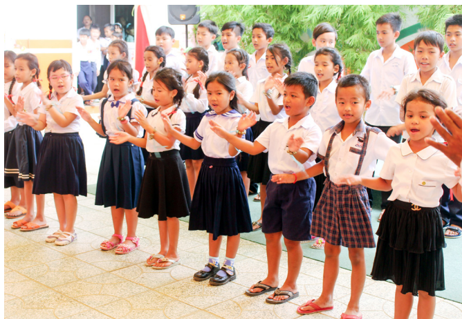
▲ 可愛認真的國小一年級學童表演。

序幕時，不禁讓後學想起在台灣的慈興講堂，每年舉辦的讀經會考也都相當成功。為什麼成功？真的感謝 天恩師德、點傳師慈悲，帶領各社區講師用心經營；當初訂了設立 6 個讀經點的目標，由負責講師各自找地點招生，接洽里長、學校、活動中心、設計教案教讀經、教品德……，在蔡點傳師的慈悲鼓勵推動之下，慈興上下一心，同心同德，發揮團隊精神，讓社區親子讀經班起飛。每當黃昏時刻，在慈興廣場的台階，總會看到講師們下班後來匆匆的身影，買個麵包、包個飯團，或一包泡麵，即前往負責的讀經地點教學，歲月匆匆，16 年如一日……。