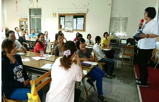
▲ 家長班，帶來許多親子間相處的省思。

年修得同船渡，百年修得共枕眠。」家人的緣份很深，父母所扮演的角色更是重要。但「家家有本難念的經」，因為父母雙方在原生家庭的成長背景與所受家教不同，加上不同的民情文化，及個人特質、態度、脾氣、毛病的差異，夫妻間無論是道德觀、政治理念、社會價值觀等，都難免有衝突之處，致使在教養子女的態度方面也會有所不同，這是導致家庭關係不和諧的因素之一。