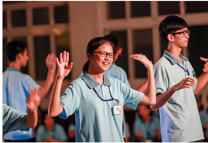
▲ 令人難忘的營火晚會。

一年一度的生服營，因為是年度既定活動，所以早早就向公司請假。活動前幾日，同事跟後學說：「有