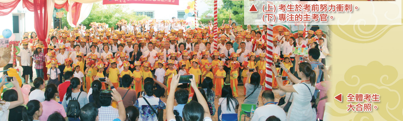
◀ 全體考生 大合照。