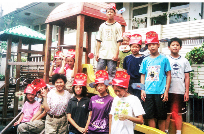
▲ 和頂番國小讀經班同學們合影。

馬來西亞回來後，有一位道親在中國大陸推動讀經和素食，他知道我在教料理，於是就一直叫後學年底去協助他，後學就坦白跟他說：「我之前已經出國1個月了，經濟不許可啦！過年又快到了，我無法去，明年再跟你去。」他告訴後學：「妳這一次去跟下一次去不一樣啦！」後學才勉為其難答應：「那去6天就好了。」