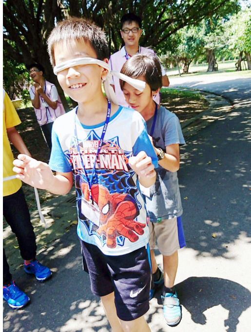
▲ 在「義」的關卡中，體驗互助合作的重要。

下課前，各隊錦旗已是插得遍地，學員熱烈參與的情況可想而知。甚至，有好幾位學員在下課後，仍緊拉著輔