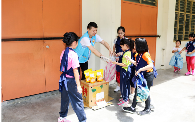
▲ 讓孩子們感受媽媽懷孕時，買東西、提重物的辛苦。

午餐時間尚未來到，孩子們已飢腸轆轆，詢問何時可以用餐。打開便當盒蓋的一瞬間，孩子們：「哇～哇～哇～！」的讚嘆聲不斷，對於菜色非常滿意，有趣的是當中有幾位學生，因為沒吃過海帶，不敢嘗試，有點可惜。