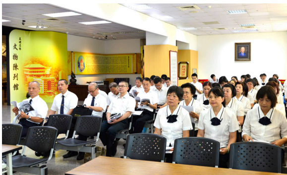
▲ 導覽人員培訓，專注聆聽重點。