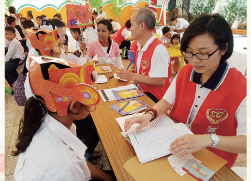
▲ (上) 考生於考前努力衝刺。 (下) 專注的主考官。