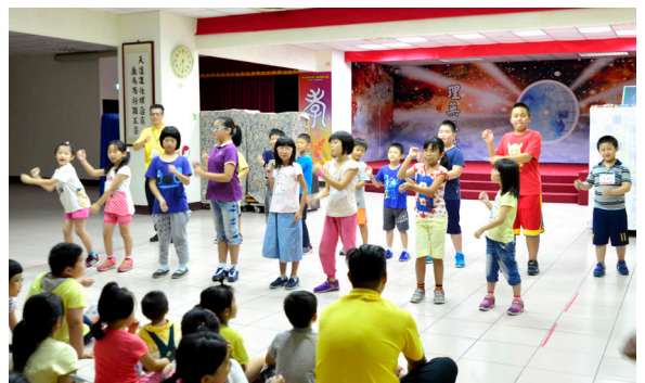
▲ 先天單位三重區國小夏令營，歡樂律動時光。