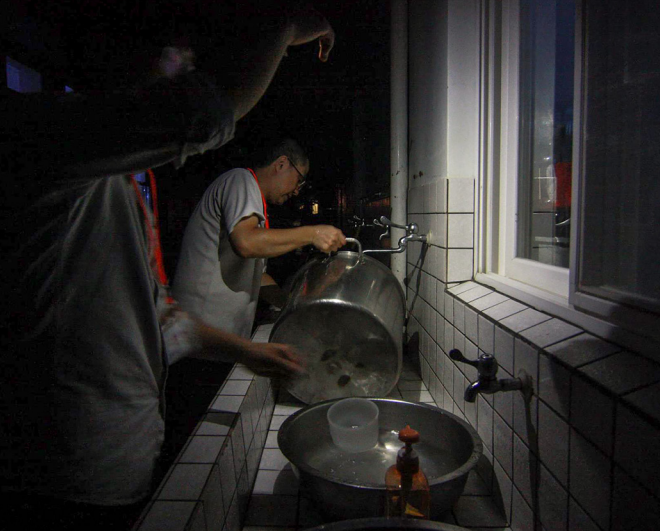
▲ 颱風天停電，依舊把碗盤洗完。

氛更是嗨到最高點。因為颱風，反而更拉近彼此的距離。最後一天的分享中，學員都忘了颱風來襲，只記得好玩的營隊，以及依依不捨的依戀。