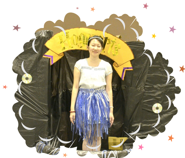
▲ 首次學習活動組，勇於突破自己。

夏令營活動中，歡迎歌、認識遊戲、道寄韻律、餐歌、早操、晚會演戲及大團康，大部分都是自己第一次