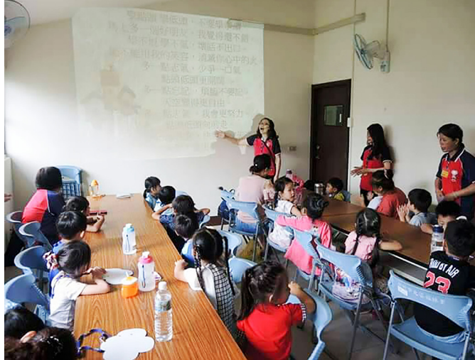
▲ 幼幼班帶動唱課程。

學齡前的小朋友需要較多的協助，所以除了主要負責授課的師資外，也增加好幾位協助照顧的師資。