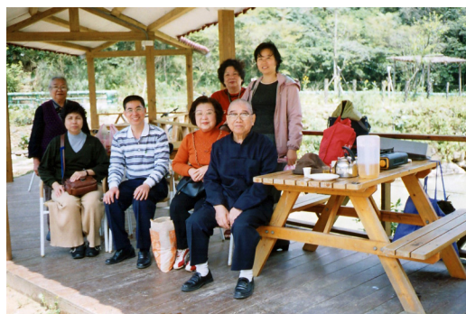
▲ 蔡點傳師、方文華點傳師（左3）和道親聯誼。