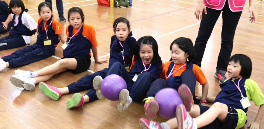
▲ 馬來西亞濱華一校生命體驗營，感受父母的永不放棄。