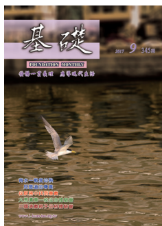
〈鳳頭燕鷗低語〉 圖 施駿龍 / 文 岱文