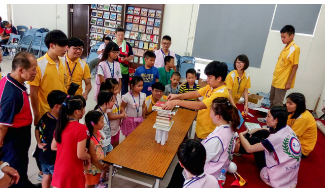
▲ 考驗固若金湯的緊張時刻。

遊戲規則： 小組員兩兩一組，其中一人以布條先綁住對方的雙手，然後出發到指定位置解開布條；再相互交換，蒙住另一人的眼睛，並口頭引導同伴走到指定的位置之後，再次解開布條；最後用此布條綁住雙方的腳踝，以兩人三腳的方式走回原地。