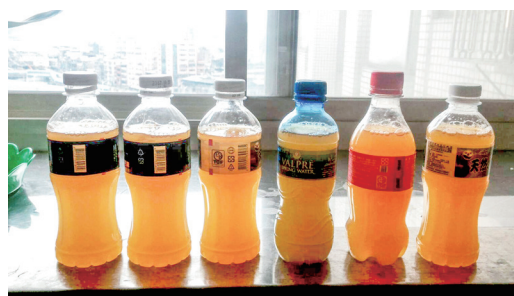
▲ 小瓶裝可拿來送人，藉機成全並推廣。