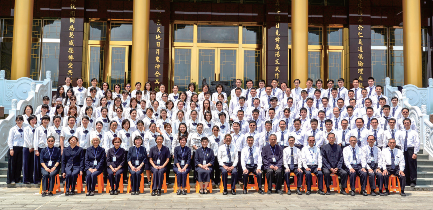
▲ 心靈成長班第一期講師驗收合影。