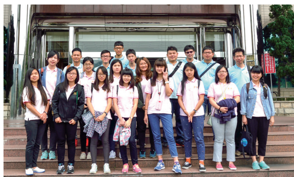
▲ 忠恕學院學界班同學參訪合影。