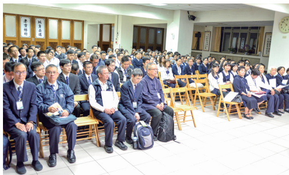
▲ 專注聆聽講師驗收注意事項。