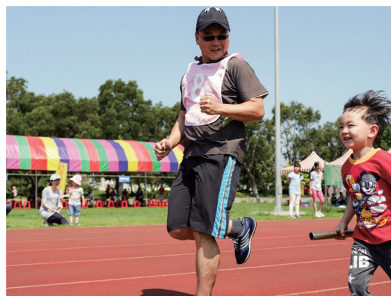
▲ 親子一起進行大隊接力的溫馨時光。

就這樣，4 隊人馬各自分成 4 小組前往接力區，激烈賽事正一觸即發！就定位不久，起跑哨音響徹雲霄，