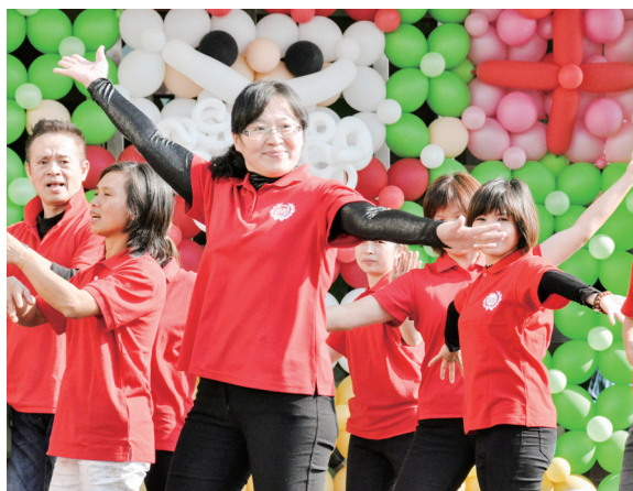
▲ 架式十足的志工帶動嘉年華氣氛。

於是！相處之間如切如磋、如琢如磨，有人欣賞火花之美，有人卻燒得焦頭爛額、撞得頭破血流，當降伏不了無明時，欲背起行囊，萌生各奔前程之念，在這佛、魔升降的緊要關頭，是您如春日和風，吹散雲霧，是您如嚴師慈母般地呵護與鼓勵，如牧羊人指引迷途的羔羊，您說：「此生此世，要有必定成佛的決心、愿力，才能衝破驚濤駭浪。」