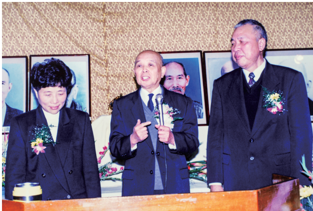
▲ 1993 年，老前人與黃總領導點傳師參加先天道院成道前輩追思紀念活動。