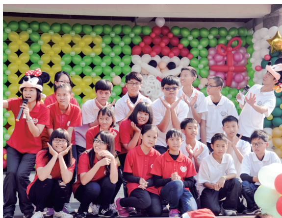
▲ 活潑勇敢地展現自我的隊伍。

（註2）；學習常不輕菩薩視一切眾生皆是未來佛（註3）。凡事反求諸己，才是清修團體的團結、修道的風範、一貫道的價值。