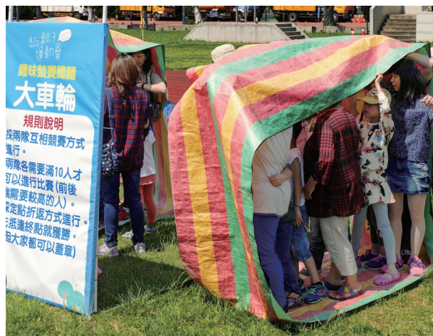
▲ 需要家人相互配合的大車輪遊戲。

大隊接力結束後，就換「趣味闖關」登場了。這次活動依然出動道育班國、高中的同學來擔任志工關主，他們事前不但花時間構思闖關內容，前一天更是到現場進行演練與模擬，