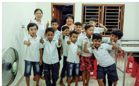
▲ 與天真純樸的小朋友快樂留影。

收拾行囊準備回國，家人、朋友在台灣等著我們回來；而異鄉的遊子，我們是否想過？家鄉有個老中娘倚閭盼望、淚水滴滴，也盼望著我們趕快回去團圓。後學唯有行功立德，效法前人、點傳師的精神，把愛散播出去，如同蒲公英的種子，飛往世界每