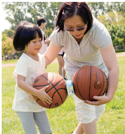
▲ 媽媽和寶貝默契地用籃球運送牛奶。

各隊第一棒賣力地衝了出去。這時，有些原先在休息區的家長們，除了起身為奮力奔跑的孩子們加油外，也按下快門留下難忘的一刻。