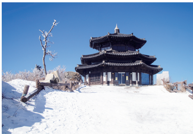
▲ 德裕山國立公園雪景。

第三天一早，我們從繩墨法壇出發到德裕山國立公園的度假村，搭乘纜車至 1,500 公尺高的雪天峰欣賞雪景。當天天氣很好，視野很清楚，山景很美，雪地很滑，樹上積雪也沒那麼多；我們沒穿雪地保暖的服裝，不敢在雪地亂走，僅在景點拍拍照就下山回繩墨法壇了。