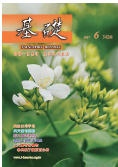
〈油桐花〉圖 游重斌 文 岱文