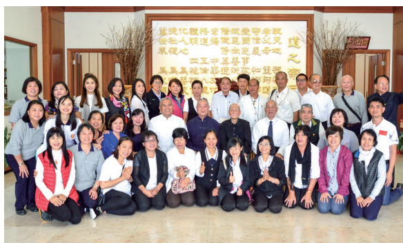
▲ 陳前人、黃總領導點傳師與瑞周天惠單位泰國等國外道親合影。