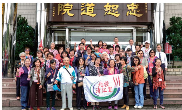
▲ 瑞周全真至善單位邀請社區鄉親參訪。