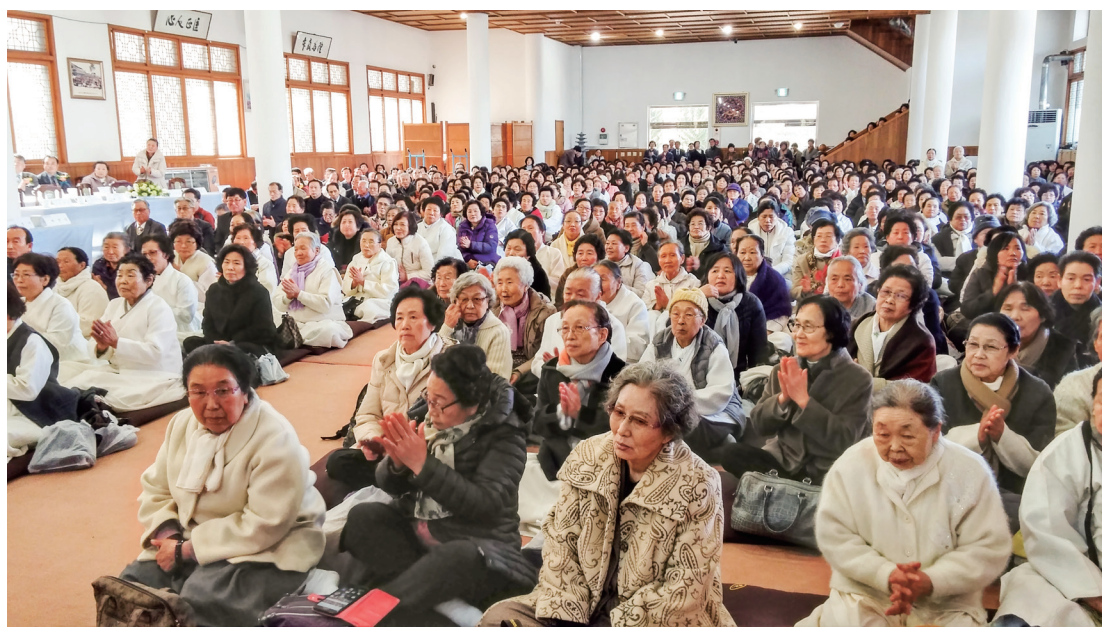
▲ 金老前人追思紀念會，充滿無限的感念與感動。

追思紀念會最後以一首道歌〈再一次相聚〉，凝聚每位道親的道情，在互道珍重歌聲中結束。