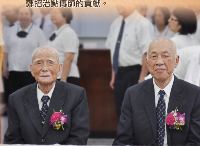
▲ 陳前人與黃總領導點傳師慈悲蒞臨同慶。