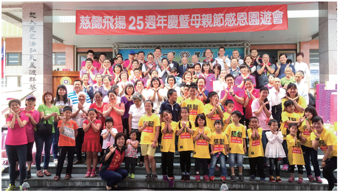
▲ 慈懿道院 25 週年慶，歡喜大合照。

義賣等多元攤位，讓大家滿載而歸。這特別的素食園遊會，不僅吃、喝、玩、樂，一應俱全，也讓更多人有機會享受素食的健康與美好。更藉由此機緣傳達「人溺己溺、人飢己飢」的精神，將義賣所得新台幣二萬元捐贈給禪光育幼院。