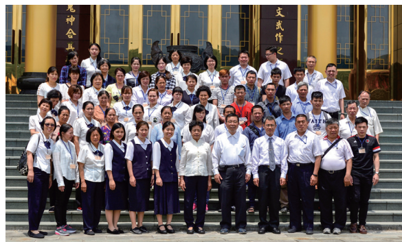
▲ 瑞周金剛單位點傳師與道親們於祖師殿外留影。