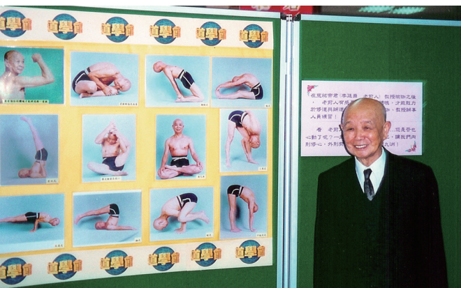
▲ 老前人攝於忠恕道院落成時2樓文物展。