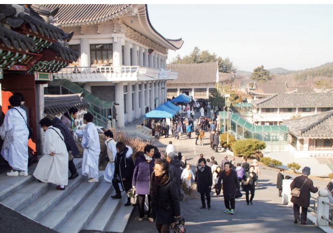
▲ 繩墨法壇及場外的義賣會。

都是前人們辛苦建立來的，卻有時還會不知足地計較著呢！上午 11 點，接著開始進行「金老前人傳道 70 週年暨成道 26 週年」追思紀念會。