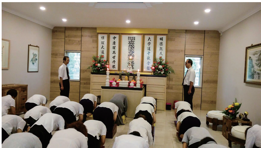
▲ 作者搬家當日申堂移堂的照片。