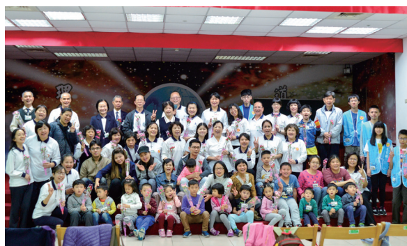
▲ 瑞周全真至善單位讀經班親子歡度快樂時光。