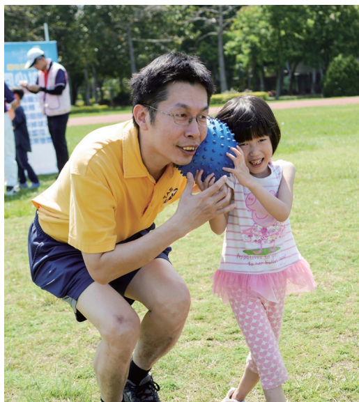
▲ 親子間同心協力地運送球。

曲終人散，是每個活動的必然結果。幸而，拜社群網站所賜，許多家長回家後，紛紛寫下自己內心的感動，而這些話語都讓辛苦付出的師資們感到很窩心。每一句感謝都是一個美妙的音符，這旋律圍繞著你我，串起天仁單位竹南頭份地區的讀經班，讓我們期待下次共譜樂曲的日子。